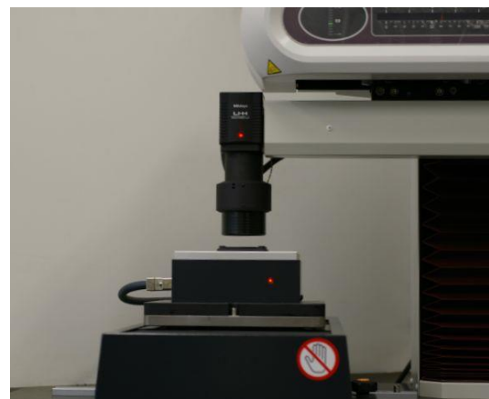
図2 非接触式（レーザ光により測定）

図3および図4に二次元測定結果および三次元測定結果をそれぞれ示します。測定結果はパソコンによってデータ解析することができます。