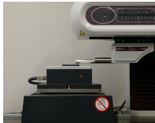
図1 接触式（触針により測定）

測定物によっては、測定機から出るレーザ光の反射、散乱、吸収などが影響して誤差を生じる場合があります。