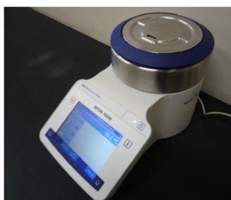
図 1 装置の外観

メトラー・トレド株式会社製の自動融点測定機 MP80 (図 1) の概要、仕様、測定について紹介します。