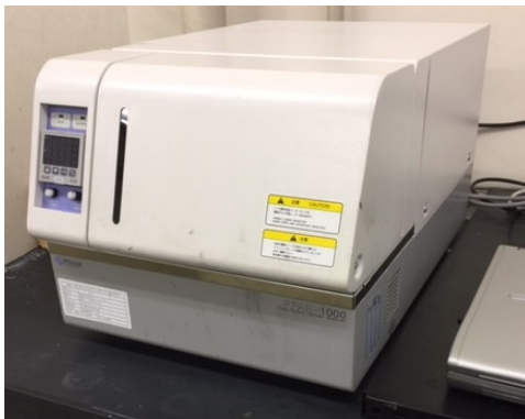
図 1 装置の外観

当研究所森之宮センターに設置されている大塚電子株式会社製の濃厚系粒径アナライザー FPAR-1000 (Fiber-Optics Particle Analyzer; 図 1) の概要についてご紹介します。