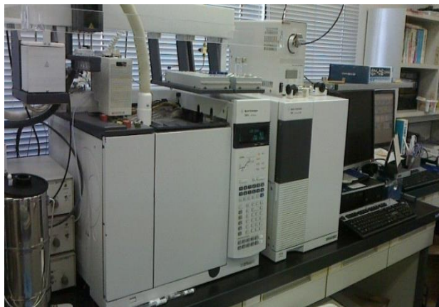
図1 熱分解 GC-MS 外観写真

装置の外観写真および構成を図 1、2 に示します。装置は熱分解炉 (パイロライザー・Py)、ガスクロマトグラフ (GC)、質量分析計 (MS) で構成されています。試料カップに極微量の試料を入れて、あらかじめ所定の温度に加熱した熱分解炉に投入することにより瞬間加熱し、発生したガスをガスクロマトグラフで分離し、分離された個々の化合物を質量分析計で分析します。