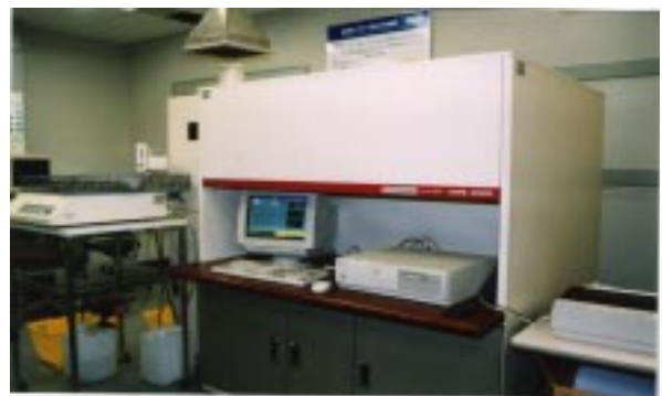
図4 ICP発光分光分析装置の外観

この分析法では酸などを用いて試料を溶液にするため、分析前処理が煩雑で、また、ノウハウを必要とする場合があります。例えば、溶液にする際に沈殿物や溶け残りなどの残さが生じた場合、さらに別の方法で残さを溶解しなければなりません。