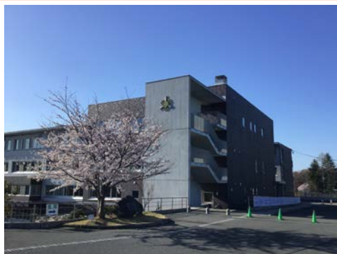
宮城県仙台第三高等学校