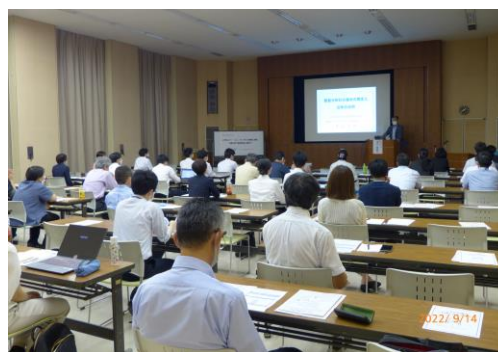
セミナー会場の様