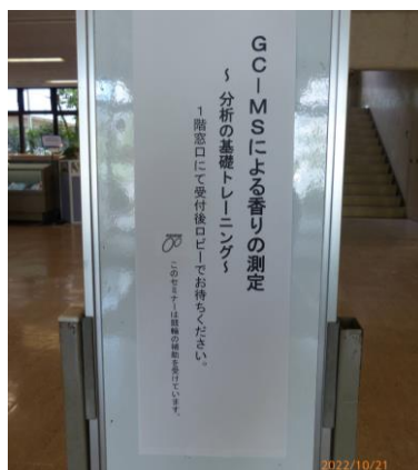
センター入口案内看板