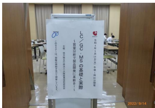
会場入口案内看板