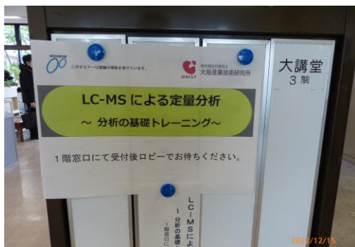
センター入口案内看板