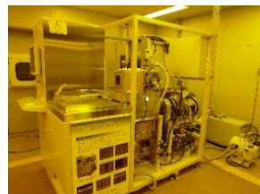
機器型番：MUC-21 ASE-SRE (SPP テクノロジーズ株式会社)

高速シリコンディープエッチング(DRIE)装置 MUC-21ASE-SRE (SPP テクノロジーズ株式会社)を用いた初心者向けの講習を開催します。本講習では、機器の概要を説明した後、実際に機器を用いて操作方法や加工プロセスを解説します。加工したサンプルや、走査電子顕微鏡による形状観察の結果もご紹介します。