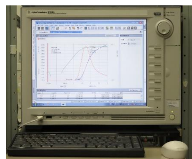
機器型番：B1500A キーサイト・テクノロジー株式会社

半導体パラメータアナライザに関する初心者向けの技術講習会を開催します。半導体パラメータアナライザは、高感度の電流/電圧(IV)測定、インピーダンス(CV)測定、高速IV測定が1台で完結する測定器です。電気抵抗素子、キャパシタ、半導体デバイスなど様々なデバイスの電気特性評価に活用されています。本講習会では、半導体パラメータアナライザを使用する際に知っておくべき基本知識や測定対象物との電氣的な接続方法について解説します。その後、電子デバイスのIV特性、CV特性等を測定して頂きます。