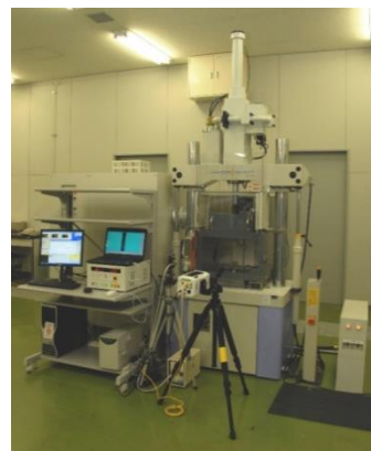
高速引張り試験機

本講習会では、高速引張り試験機(小容量試験システムを含む)の特徴や使用方法をご説明するとともに、高速引張り試験の実習(試験片は当所でご用意します)を交え、試験で得られるデータについて解説します。