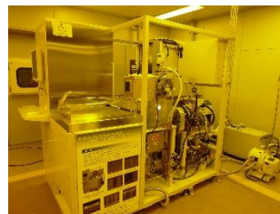
機器型番：MUC-21 ASE-SRE (SPP テクノロジーズ株式会社)

高速シリコンディープエッチング(DRIE)装置MUC-21ASE-SRE (SPPテクノロジーズ株式会社)を用いた初心者向けの講習を開催します。本講習では、機器の概要説明を行った後、装置の操作方法を説明しながら、実習用のサンプルを実際に加工いたします。その後、走査電子顕微鏡により形状観察した結果を紹介します。