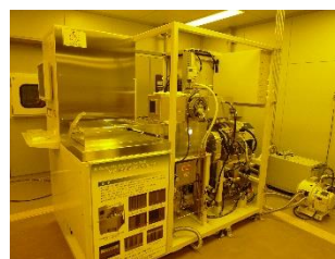
機器型番：MUC-21 ASE-SRE (SPP テクノロジーズ株式会社)

高速シリコンディープエッチング(DRIE)装置MUC-21ASE-SRE (SPPテクノロジーズ株式会社)を用いた初心者向けの講習を開催します。本講習では、機器の概要説明を行った後、装置の操作方法を説明しながら、実習用のサンプルを実際に加工いたします。その後、走査電子顕微鏡により形状観察した結果を紹介します。