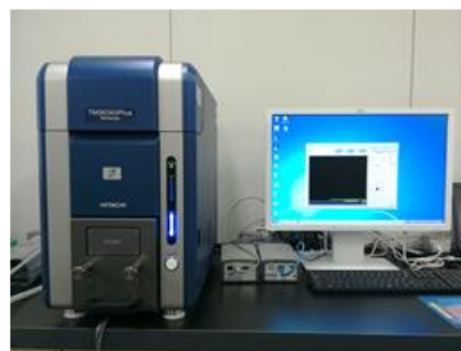
低真空走査電子顕微鏡

低真空走査電子顕微鏡は電子顕微鏡(SEM)とエネルギー分散型X線分析装置(EDX)から構成されており、観察と元素分析を簡便かつ迅速に行うことが可能です。プラスチックなどの絶縁物の表面観察、水分や油分を含む食品、生体試料および生物試料など様々な試料の観察が可能です。 マイクロメートルオーダーの試料観察に最適 です。