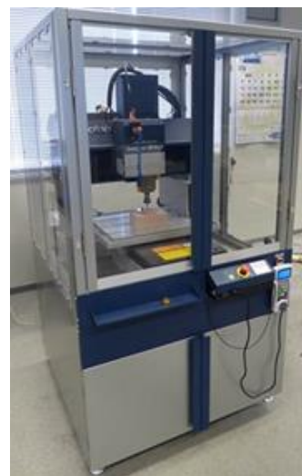
ものづくり工房3次元切削加工機

本講習会で使用する3次元切削加工機は、Roland D.G.株式会社製のMDX-540Sです。主な仕様は、切削加工サイズが350×300×100mmで、最大4本のエンドミルを交換しながら切削することができます。