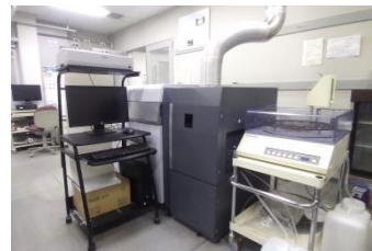
ICP 発光分光分析装置

当研究所ではお客様とのディスカッションを通じて最適な分析手法を提案しております。鉄鋼の成分分析に用いる装置の中から3種類を取り上げ、簡単な実演を行います。