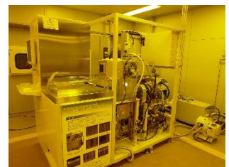
機器型番：MUC-21 ASE-SRE (SPP テクノロジーズ株式会社)

高速シリコンディープエッチング(DRIE)装置MUC-21ASE-SRE (SPPテクノロジーズ株式会社)を用いた初心者向けの講習を開催します。本講習では、機器の概要説明を行った後、装置の操作方法を説明しながら、実習用のサンプルを実際に加工いたします。その後、走査電子顕微鏡により形状観察した結果を紹介いたします。