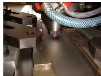
摩擦攪拌接合装置（FSW）