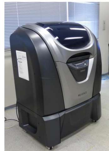
ものづくり工房3Dプリンタ装置

本講習会で使用する3Dプリンタは、株式会社キーエンス製のAGILISTA-3100でインクジェット方式の装置です。主な仕様は、造形サイズが297×210×200mm、積層ピッチが15μmもしくは20μm、解像度は635×400dpiです。