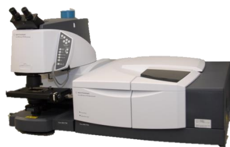
フーリエ変換赤外分光光度計 (FT-IR)

赤外分光法は、測定対象の物質(試料)に赤外線を照射し、透過(あるいは反射)光を分光することでスペクトルを得て、試料の特性(分子構造や状態)を知る方法です。このスペクトルを得るために、フーリエ変換赤外分光光度計(FT-IR)がよく用いられ、油料、プラスチック、ゴム、繊維、塗料、農薬、医薬品などの有機化合物(および一部の無機化合物)の評価には不可欠となっています。また、微小領域(～ \mu\text{m} レベル)の測定が可能な顕微FT-IRは、製品の品質管理(異物分析や劣化状態)に用いられます。本講習会では、装置の概要(装置構成、仕様、測定モードなど)について簡単に説明した後、異物分析などでよく用いられる一回反射ATR法、顕微ATR法などの測定モードについての実習を行います。