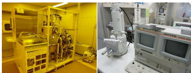
機器型番： MUC-21 ASE-SRE (SPP テクノロジーズ株式会社)

MUC-21ASE-SRE (SPPテクノロジーズ株式会社)を用いた初心者向けの講習を開催します。本講習では、機器の概要説明を行った後、装置の操作方法を説明しながら、実習用のサンプルを実際に加工いたします。その後、走査電子顕微鏡JSM-5310(日本電子株式会社)で形状観察します。