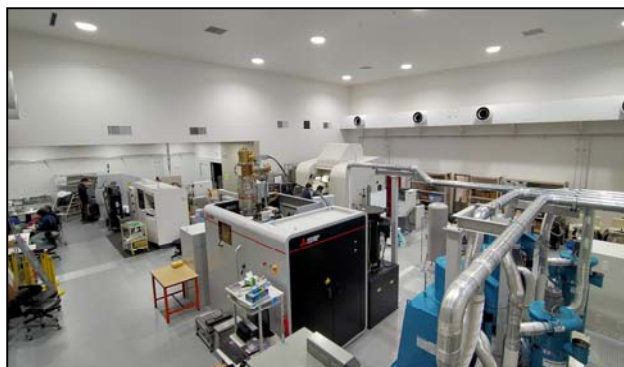
3D造形技術イノベーションセンター（令和3年4月開設）