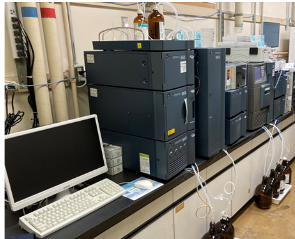
高分子絶対分子量測定装置システム 全景