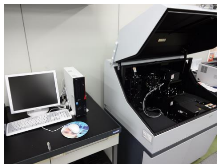
機種名：島津製作所株式会社製 Solid Spec 3700

さらに、試料への入射角を任意に変化させながら、反射率および透過率を測定できる可変角絶対反射測定装置を備えていますので、光学特性の角度依存性を詳細に評価することができます。