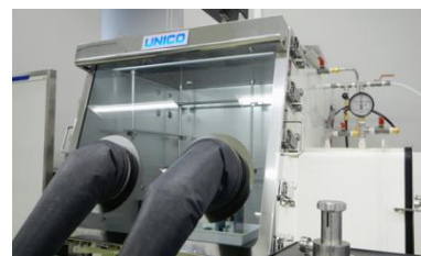
アルゴン雰囲気 グローブボックス