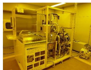
機器型番：MUC-21 ASE-SRE (SPP テクノロジーズ株式会社)

高速シリコンディープエッチング(DRIE)装置MUC-21ASE-SRE (SPPテクノロジーズ株式会社)を用いた初心者向けの講習を開催します。本講習では、機器の概要説明を行った後、装置の操作方法を説明しながら、実習用のサンプルを実際に加工いたします。その後、走査電子顕微鏡により形状観察した結果を紹介いたします。