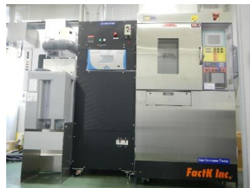
二酸化硫黄ガス腐食試験 (連続フロー式) (H30年度導入)