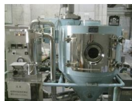
スプレードライヤ