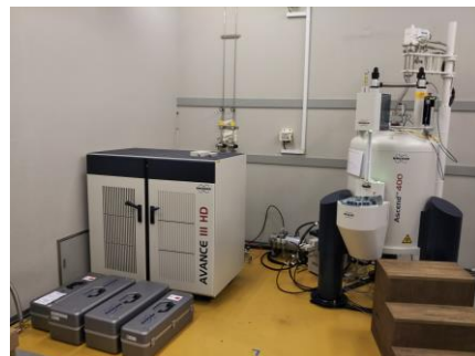
図1 核磁気共鳴装置の外観図

講習会では、本装置の概要や基本性能について説明と、実際の測定を通して、NMR測定から得られる情報、他の有機分析との違いについて説明します。時間の都合上、溶液NMR測定のみを行います。