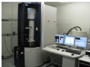
走査透過電子顕微鏡 (Cs-STEM)